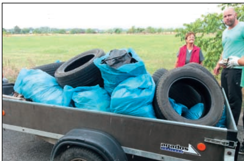
Není třeba komentář

časné době obec nemá možnost odvozu, ale již byl starosta pověřen zastupitelstvem k nákupu vhodného vozidla, abychom opět mohli zajistit pro své občany službu svozu.