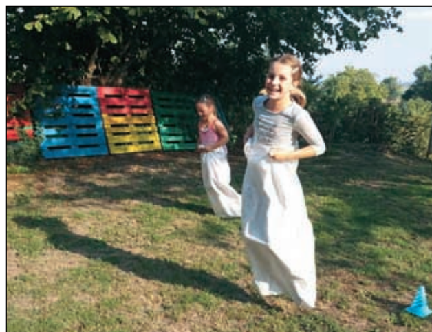
Hastrmánek zahájil zvesela.