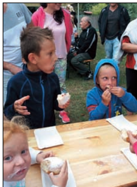
Děti se skvěle pobavily...