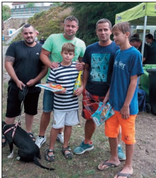
Vítěz se starostou.

Dne 25. srpna se na hrázi u Labe konal 16. ročník „Žalhostické neckyády“. Nebe se nám sice trochu zatáhlo, ale nepršelo a alespoň nebyla ta děsná vedra.