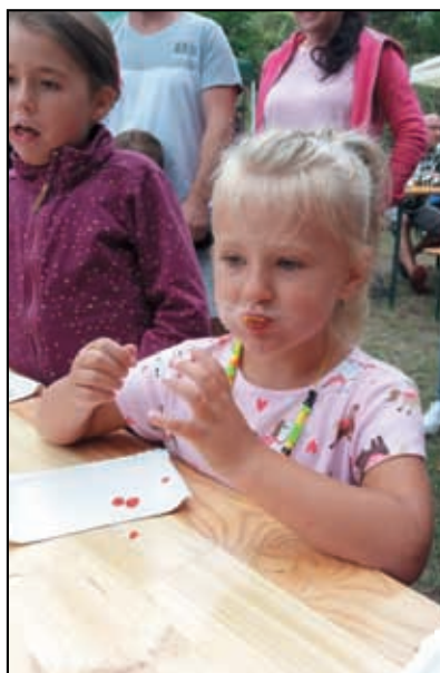
To je to dobré a ještě vyhraju...