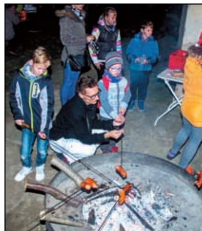
Kdo se pekelného ohně nebojí, opeká si špekáček...