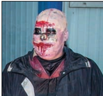
Jméno: Rozparovač Labský Věk: 237 let Bytem: Žalhostice 126