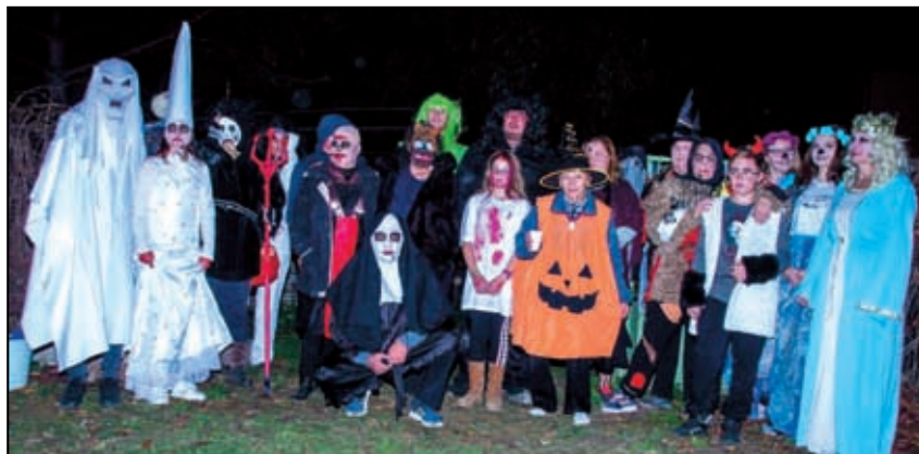
Výběr strašidel střední Evropy

Tedy dlouhé podzemí, kde žijí moji strašidelní kolegové s trvalým pobytem přímo v obci Žalhostice. Musím říci, že kdyby nebylo opékání buřtů, čaje a svařeného vína na konci, měli bychom s kolegy určitě hodně polapených dušiček. Jako strašidlo, které pouze škodí, jsem byl však zklamán tím, že