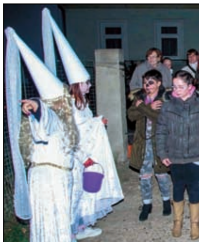
Strašný zájem o strašidla

Takže se spolu se mnou těšte na Strašidlák 2019!! Váš Leopold