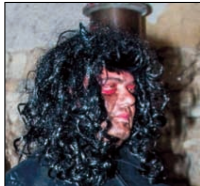
Jméno: Ošklivec Pekelný Věk: 172 let Bytem: Štětín, Polsko