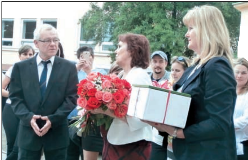
Loučení s panem ředitelem školy.

kdy 7 členů komise (složena ze zástupců rodičů, učitelů, školské rady, zřizovatele školy, krajského úřadu odbor školství, školské inspekce a ředitele srovnatelné venkovské školy) posoudila, zda uchazeč splnil všechny požadavky zadané zřizovatelem.