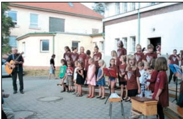
Akademie základní školy.