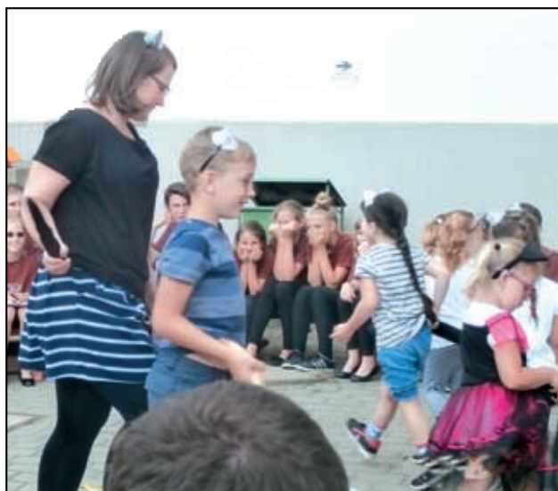
Kouzelná koťátka naší mateřinky.