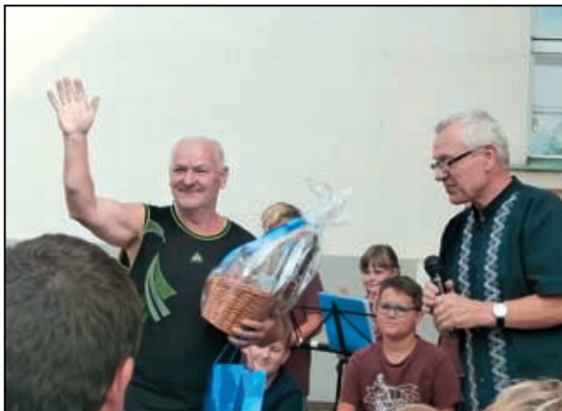
Čágo belo pane školník.