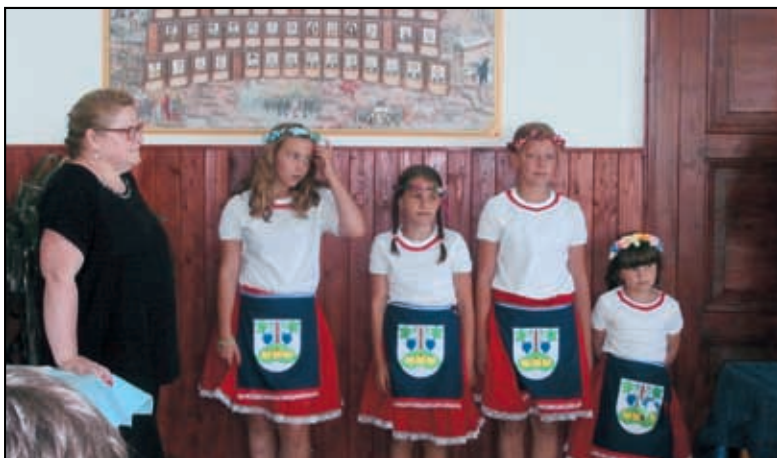
Děti z Hastrmánku .