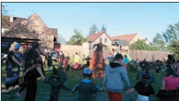
Tanec okolo čarovného ohně.