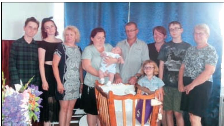
Rodina okolo miminka.

V kronice nám přibyl další pamětní záznam a v obci je nás zase o jednoho víc a to je moc dobře.