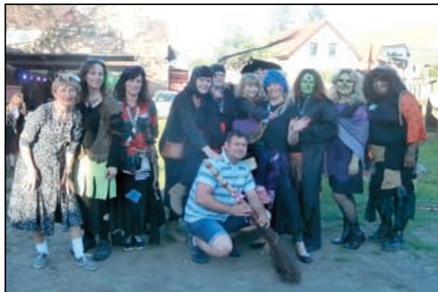
Starosta v zajištění magických žen.