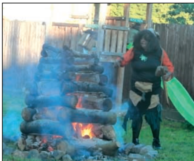
Čarodějnice Jaruška, vládkyně ohně.