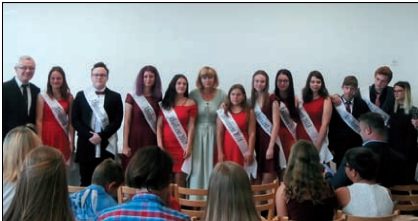
Loučení s devátou třídou.

Pan ředitel bude i nadále učit na naší škole češtinu a hudební výchovu. Přejeme mu hodně zdraví a štěstí do dalších let.