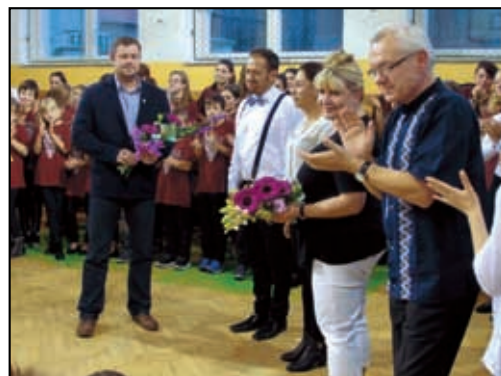
Pan starosta poděkoval za krásné vystoupení.