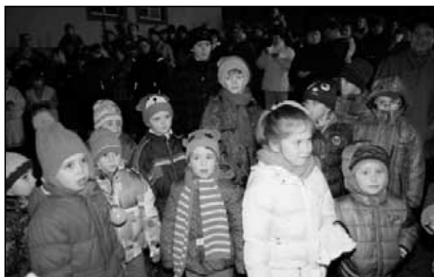
Děti vyprávěly o adventních zvycích