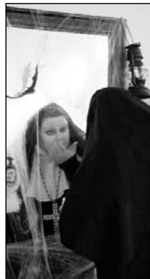
Jeptiška ze záhrobí