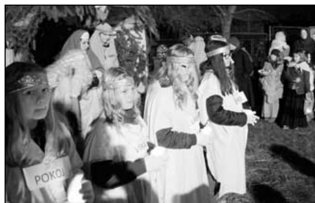
Ztvárnění čtyř svíců na adventním věnci - Pokoje, Víry, Lásky a Naděje