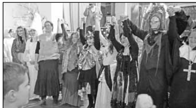
Díky a zase za rok...

registrováno na 18! A ty byly - krásné, nevídané, velice kreativní, prostě fanfárové.