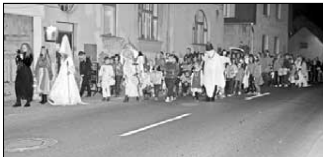
Dušičkový průvod nebral konec.

Děti byly statečné, ale nebyť ochránců rodičů, atribut od strašidel by si neodnesly!). Nakonec se všichni ohřáli u ohně a společně se vydali do Doupěte strašidel, kde všechny přivítala děsivá a přišemé zvuky dělající hlava bubáka, u vstupu číhala baba Jaga, úžasná výzdoba doupěte, kde stoly osvětlily lucerničky a krásné dýně - tímto skládáme hold Vašku Puckovi, který nás jimi dostatečně zásobil, vznášející se kostlivci, duchové, tajemné zrcadlo s tříhlavým psem, obří dýně z kartonu, které nám vyrobily děti z místní základní školy no a Sváta se svým divídem, který dětem zahrál pohádku. Program zahájila družinka ze základní školy Litoměřice svým roztomilým tanečním vystoupením - od obce dostali všechny děti dárek - čarodějnický klobouk. Celý zbytek programu v doupěti, byl již v režii Svátí a musím říci, že si to děti náramně užili. A aby ne, přišlo jich na 70, masku měli všichni a jaké! Jmenujme alespoň některé - bezhlavý rytíř, upírka, bílé paní, kostlivci, démoni, duchové, strašáci do zelí, zombici, čarodějnice, dýničky, atd. Dýni do soutěže bylo za-