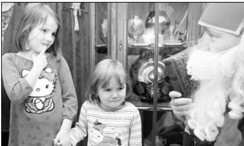
Byli tu ti čerti, čertovští...

Vzhledem k letošnímu jubileu významné změny politických poměrů v naší zemi přinášíme vybranou část z Kroniky IV., která se vztahuje k tomuto období a je shodou okolností posledním písemným záznamem kronikáře Jaroslava Švece v kronice obce.