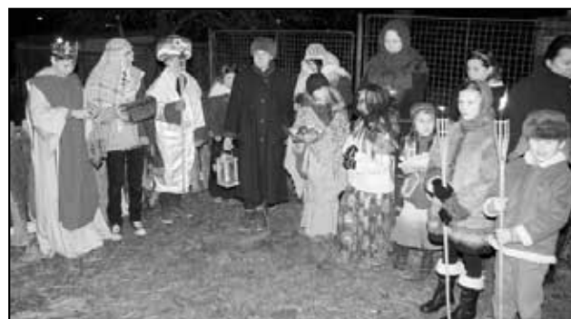
Průvod u jesliček