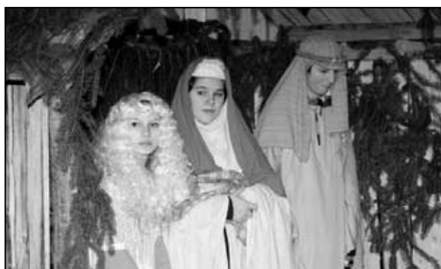
Jezulátko, Marie, Josef a anděl